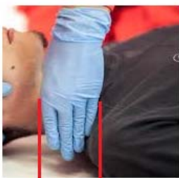
CALCOLO MISURA COLLARE