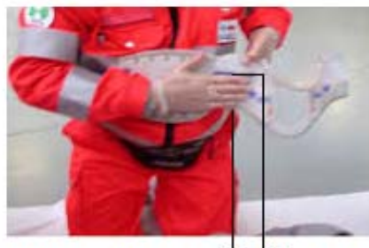
MISURA SUL COLLARE